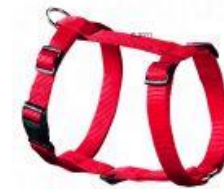
Voorbeeld van y-tuig, maar wel met vrij smalle en niet gepolsterde banden.